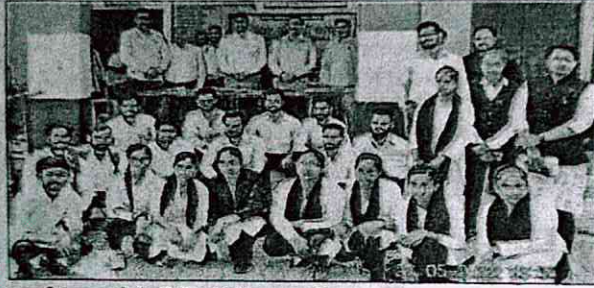
कानूनी जानकारी के शिविर में मौजूद स्कूली छात्र व अन्य