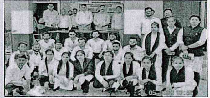
कानूनी जानकारी के शिविर में मौजूद स्कूली छात्र व अन्य